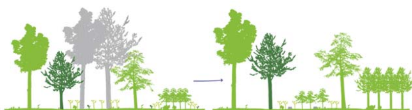
La futaie irrégulière : une coupe réalisée tous les 8 ans environ, pour amener progressivement la forêt vers un mélange équilibré d'arbres de différents âges et tailles.

Ces chantiers sont réalisés par des entreprises de travaux forestiers qui ont acheté les bois sélectionnés par l'ONF. Ces entreprises, tenues de respecter le Cahier National des Prescriptions d'Exploitation Forestière (CNPEF), sont étroitement surveillées par l'ONF. Le bois est trié en fonction du type d'essence et de sa qualité. Il est en général utilisé en bois d'œuvre, en bois d'industrie (papier, panneaux) ou en bois de chauffage.