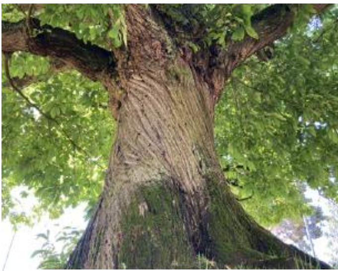
Châtaignier commun (78)

Âgé de 330 ans, ce châtaignier se démarque de ses congénères par son tronc, qui interpelle les passants avec ses irrégularités prenant la forme de cannelures en hélice. Un arbre "vissé", dit-on. Son écorce brun foncé forme une magnifique spirale partant du pied jusqu'au houppier. Autre originalité de ce châtaignier : la largeur de sa ramure. 18 mètres, pas moins. Un caractère esthétique d'autant plus accentué par la faible hauteur de cet arbre, coupé en tête à l'époque pour la production de piquets.