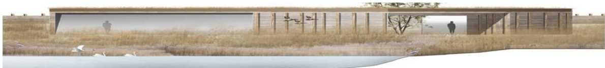
© Agence Territoires – Jean-Charles Tachon

Ces éléments architecturaux qui ponctuent les parcours d'observation doivent amener le visiteur à ressentir par l'émotion les richesses et l'ambiance du lieu dans lequel il se trouve. Cinq thématiques fortes du site seront exprimées grâce à ces affûts : les boisements, les roselières, les milieux humides, l'homme et la nature en action, les milieux aquatiques.