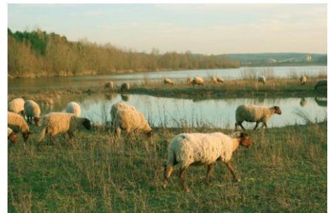
Mettre en œuvre un principe simple, adaptable aux évolutions du site

« L'objectif premier du projet est de rendre cette future Réserve naturelle régionale accessible au public. La conception des parcours doit permettre à chacun la découverte de ses richesses, sans pour autant nuire à la faune et la flore du site. Les visiteurs seront libres de circuler dans un espace dédié, ponctué de structures d'observation liées à une thématique forte du lieu où ils se trouvent » précise Claire Dupuy, chargée de mission pour le service Expertise Technique de l'Agence des espaces verts.